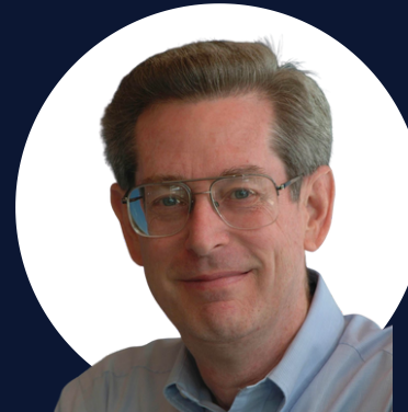
Donald D. Chamberlin.

SQL es uno de los lenguajes de programación más populares del mundo. SQL significa "Lenguaje de consulta estructurado" y es un lenguaje de programación utilizado para comunicarse con bases de datos . Fue creado por Donald D. Chamberlin y Raymond F. Boyce en 1974 y se creó inicialmente para acceder a la base de datos System R de IBM.