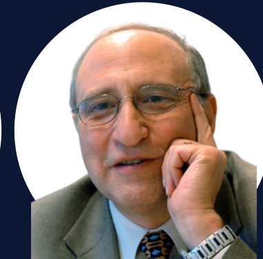
Raymond F. Boyce.

Ahora se usa ampliamente en industrias como la banca, los seguros, el comercio minorista, la fabricación, la atención médica, los productos farmacéuticos y las agencias gubernamentales para administrar datos de manera eficiente a través de consultas o conjuntos de instrucciones llamadas "consultas". Estas consultas se escriben utilizando un lenguaje de consulta SQL que se puede ejecutar en cualquier sistema de administración de bases de datos relacionales (RDBMS).